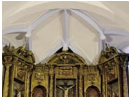
Bóveda de la Capilla Mayor

Tasación de una OBRA de cantería realizada por Juan Navedo (aderezo de la Capilla Mayor que había hecho Juan de Alvear y se había hundido en el Val de San Lorenzo. 28 de Agosto de 1595. (pag. 208)