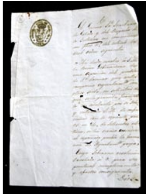
Oficio del Gobierno Civil de 1835. Comunicando la creación del Ayuntamiento

García Escudero tampoco dio cuenta de gran parte de los convenios, compromisos y concordias con los pueblos circundantes al Val fechados entre 1616 y 1883 que se hallan encuadrados en un solo volumen titulado Libro de Arcas de Val de San Lorenzo . Otros documentos que no aparecen en la relación dada por García Escudero son un Compromiso y concordia de los lugares del Val y Morales de octubre de 1833, una Carta del Ayuntamiento de Val de San Lorenzo de 26 de Abril de 1822, la Ejecutoria del pleito litigado por la Justicia, Concejo y vecinos de Val de