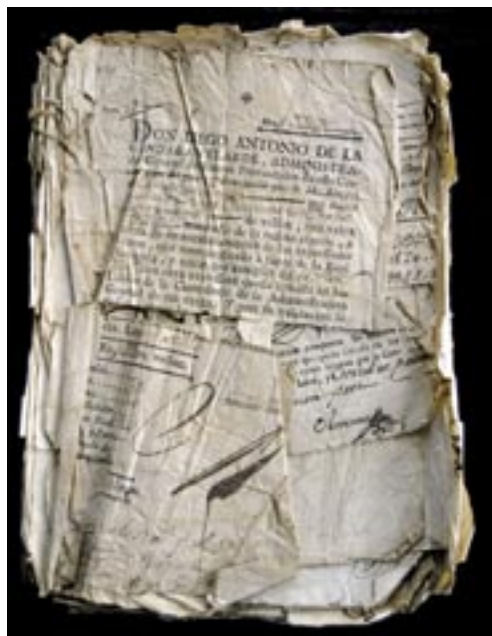
Colección de recibos sobre impuestos abonados (1737-1792)

En conclusión hemos de señalar que este primer acercamiento al archivo concejil del Val de San Loren-