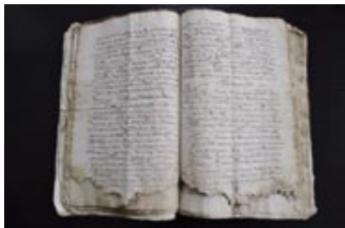
Amojonamiento de las arcas de Val de San Lorenzo (1616)

Como hemos ido viendo, el Archivo concejil del Val de San Lorenzo, se compone de numerosos documentos, fechados en su mayoría entre los siglos XVII y XIX, a excepción de cuatro