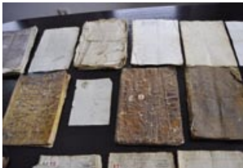
Documentos del archivo concejil de Val de San Lorenzo

Este breve artículo pretende ser un primer acercamiento a un rico conjunto de documentos, hasta ahora desconocido por la mayoría de los valeros, a la espera de posteriores estudios de carácter monográfico que completen la visión del mismo.