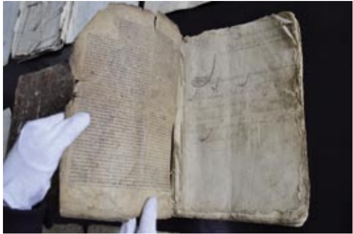
Copia de las Ordenanzas de 1741 y Ejecutoria de hidalguía de Sancho Díez de Salas (1513)

llegado hasta hoy. Otro dato curioso es la existencia del “ Libro de las Ordenanzas y su Borrón ”. Presumiblemente se refiera a las Ordenanzas conservadas, realizadas junto con su copia o “ borrón ” en 1741. Además en este inventario también se recoge la existencia de cinco compromisos (seguramente los ya citados en el Inventario de 1755 ), y “ once cáno-