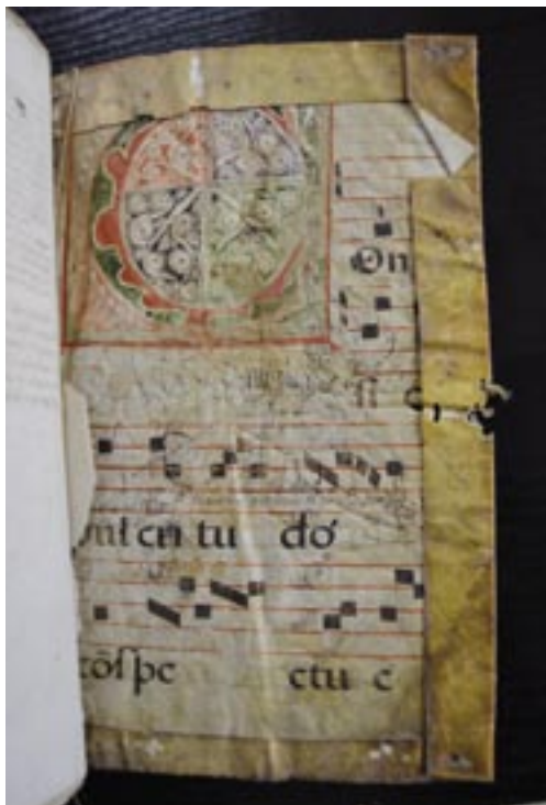
Hoja de Cantoral actuando como guarda del Arancel de los Escribanos.

los que García Escudero vio en 1953 han desaparecido. Este es el caso del Compromiso de contribuir y pechar Val de San Lorenzo, Valdespino y Val de San Román de 8 febrero 1584, las Respuestas Generales al Interrogatorio de la Real Instrucción. Letra A , fechadas en 18 junio 1752 y el Convenio entre Val de San Lorenzo y Val de San Román del 19 marzo 1798. La pérdida de estos documentos nos impide conocer su contenido. Esas Respuestas Generales por la fecha no