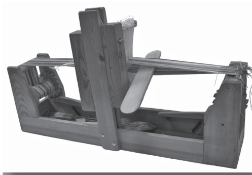
Pequeño telar de confección de ligas

Esta actividad se pretende que continúe también durante este año, pues las personas que acudieron quedaron satisfechas del trabajo, e incluso desde la Asociación se pretende que venga alguna persona que se dedica a la confección de trajes para impartir algunas clases sobre el tema