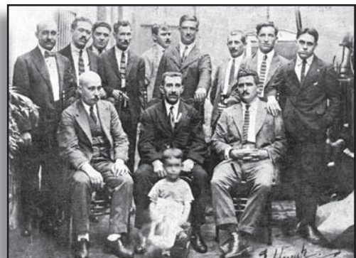
Junta Directiva de la Sociedad de Naturales de Val de San Lorenzo en La Habana, en 1922

A la entrada del parque se colocó una lápida de mármol, hoy desaparecida, que decía: "A iniciativa de la sociedad de naturales de Val de San Lorenzo en La Habana se inaugura este parque en 19 de abril de 1925".