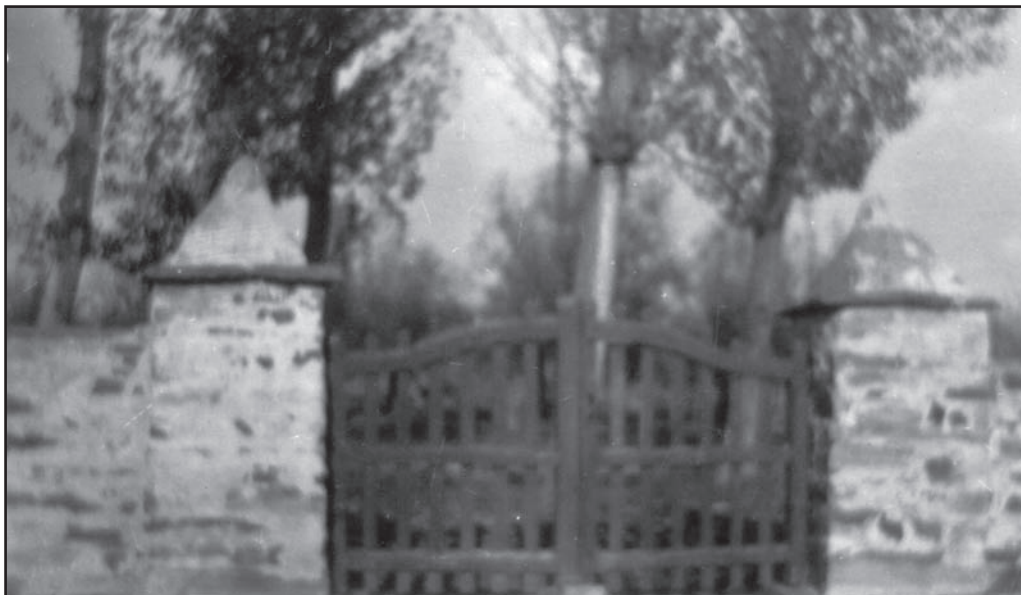
Primitiva entrada principal del parque

Por Pedro A. Cordero.