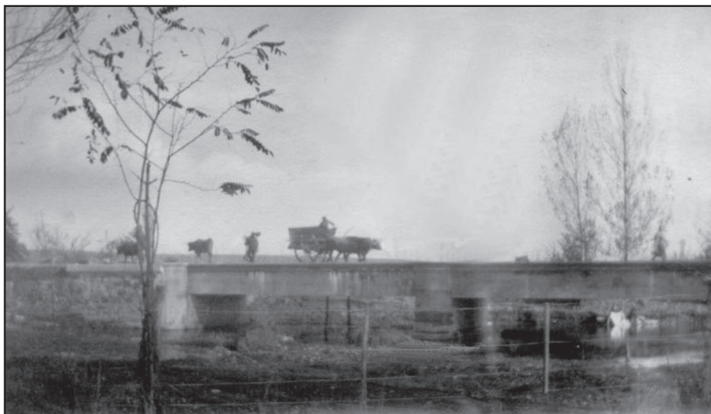
Puente del parque en 1924, con la primitiva cerca del parque en primer plano