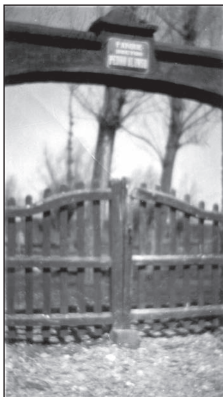
La entrada principal, el día de su inauguración