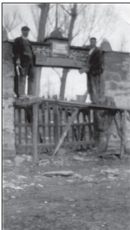
Colocando la placa