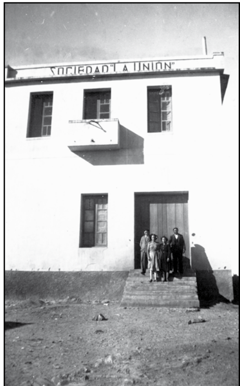
Edificio con la antigua escalera (1950)